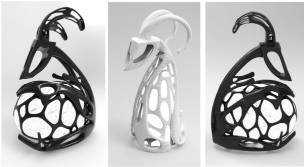
图 4 羊图腾元素和 3D 打印结构的东巴纸灯设计

传统的纳西族的文字符号应用于手工纸产品是一个全新的尝试,把民族文化融入产品造型,人们在使用产品的过程中强化对文化的体验,这会留下深刻记忆。手工纸产品通过民族文化内涵的积累、再创造和提升附加值来缩小和竞争品牌产