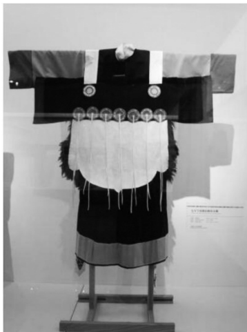
图 2 纳西族服饰的羊皮披肩

云南纳西族服饰当中最具代表性的装饰图案就是羊皮披肩,羊皮披肩上有圆形的刺绣图案,代表七星,俗称“披星戴月”,肩部有两个大的圆圈,有专家认为是青蛙的眼睛。纳西族服饰是一种图腾崇拜的体现,是对生殖崇拜的一种呈现方式。不过论文更注重的是对羊皮披肩历史源头的追述,纳西族妇女的服饰有羊皮披肩,也充分代表对羊的图腾崇拜(见图 2)。