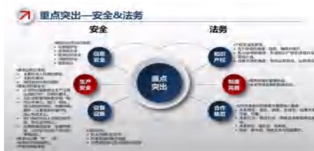
图2 安全与法务关系

心环节，它不仅涉及到企业的内部利益，同时也是企业与外部签署的主要书面材料，涉及到各相关方的合法权利与利益 [2] 。企业承担着在执行合同时对履约进行监督的责任，它们需要定期检查合同的执行情况，以确保所有参与合同的责任企业都严格按照之前制定的约定来执行职责。此外，企业还需搭建一套风险预警机制，针对那些可能干扰合同实施的风险因素进行持续的观察，一旦识别出可能存在的风险痕迹，应立即采取合适的应急措施。通过对公司内部风险管理体系与外界政府监管组织、各种行业协会等进行细致的监督和检查，能够迅速识别存在的风险隐患并适时实施相应的预防措施。这种做法有助于企业在风险真正降临之前采取先行的干预，从而减少风险带来的负面效应。安全与法务关系如图2所示。