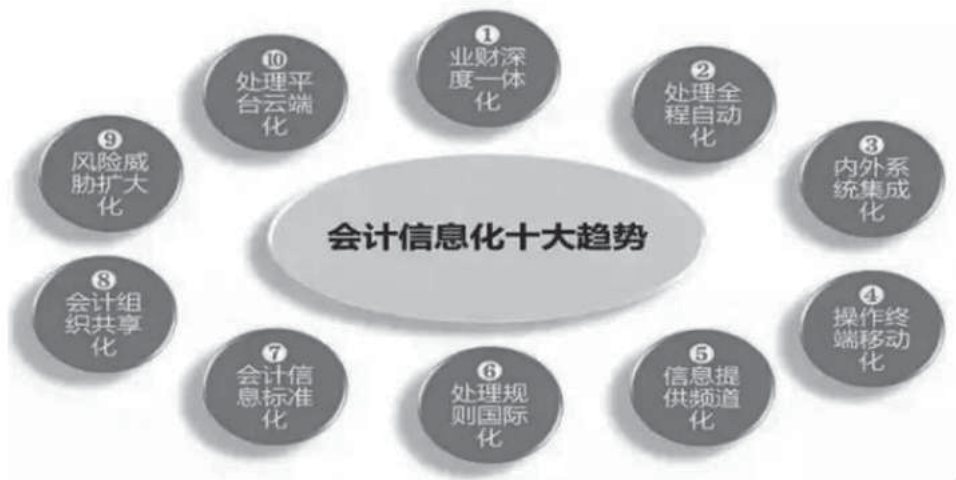
图3 会计信息化建设趋势

制制度 [7] 。会计诚信建设不仅仅是会计工作人员的职责，同样也需要企业其他职员共同努力和监督，只有这样才能使会计诚信建设的意义充分发挥出来。