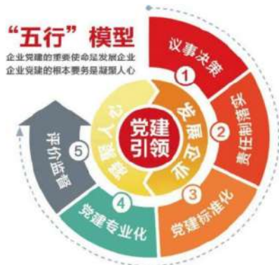
图2 党建工作五行模型

社会主义核心价值观,增强党员干部的责任感和使命感,推动企业形成良好的文化氛围和工作态度 [2] 。通过以上措施,可以有效强化国企党组织的核心领导能力,推动党建工作与企业生产经营的深度融合,实现经济效益和党的政治效益的统一。