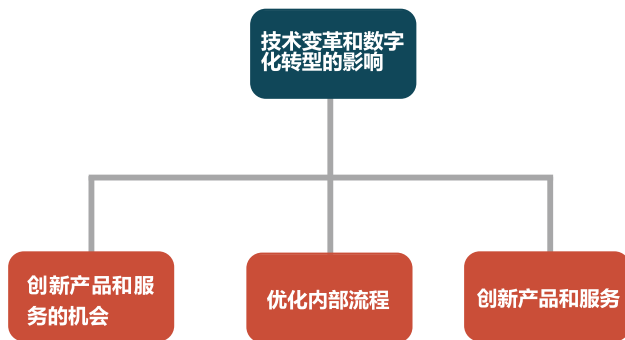
图1 技术变革和数字化转型的影响

技术变革和数字化转型可以提升企业的生产、运营和管理效率，降低成本，提高质量。例如，自动化生产线可以提高生产效率和产品的一致性；信息系统的应用可以实现数据的实时采集和分析，提供决策支持；供应链管理系统的建立可以优化供应链流程，提高物料的采购和物流管理效率等。通过技术变革和数字化转型，企业可以优化内部流程，提高资源利用效率，降低成本，并最终提供更高质量的产品和服务。建立在线渠道和社交媒体平台，企业可以与消费者进行实时互动，了解消费者的需求和反馈。大数据分析和个性化推荐算法，企业可以更精准地为消费者提供个性化的产品和服务，数字化转型使得企业与消费者之间的关系更加紧密、互动更加频繁，从而提高顾客忠诚度和品牌影响力。技术的应用，企业可以创新产品和服务，提升生产效率和质量，加强与消费者的互动和沟通，从而实现商业模式的转型与发展。技术变革和数字化转型的影响如图1所示。