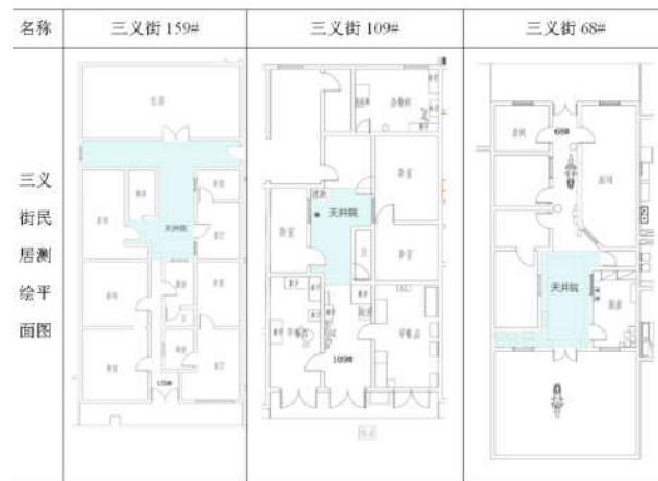
表 1 三义街民居平面图

例如，三义街 159#，由一个狭窄的通道进入建筑，除了沿街的店面对着街道开门，其他内部各个房间均朝通道开门，通道在建筑中处于核心位置，是整个建筑的公共活动空间。平面近乎中轴对称，但通道上随处可见居民的加建改造以及摆放的一些家具。建筑的另一个核心公共空间便是天井院，左右两侧原来应是厢房，或被隔为两间，一间作为平时会客吃饭的场所，一间作为卧室。而在厢房旁，均有加建厨房和卫生间的现象，这反映出建筑内部使用空间的缺乏，厨房和卫生间大多为公用，生活环境质量较差，人群混杂。穿过天井院，通常会到达正房的位置，称为一进天井院，也有建筑是穿过两个天井院再到达正房，称为两进天井院。“暗一明一暗”的这种平面形制在三义街的民居中较为典型，同样的特征在三义街 109#、161# 和 68# 建筑里也有所体现。