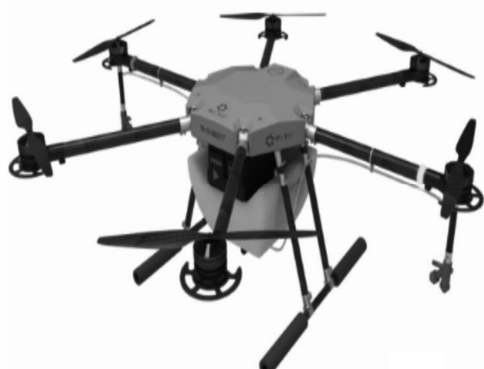
图2 多旋翼型无人机

其中,固定翼型无人机应用主要是通过动力系统和机翼滑行来实现升降起飞,利用固定翼型无人机能够保障整个测绘应用中的时间效率,且其本身承载负荷较大、测绘效果高的特点,能够保障在大范围航测应用价值更大。多旋翼无人机在山区有水利测绘中的应用,其本身具有的对起飞场地要求不高,可以垂直升降等特性,使得其在对山区大比例尺水利测绘中的应用较为普遍。因此,结合实际情况做好对无人机类型的合理选择使用,明确其不同类型功能特性优势,以此使山区水利测绘质量能够完全得到保障。