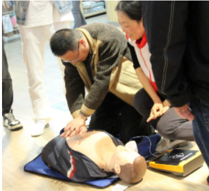
图1 应急救援技巧培训

上,明确只有加强资产的安全管理,才能够为单位经济效益的持续提供奠定基础,进而对资产安全管理工作的开展予以高度的重视。再次,严格按照国家安全生产的方针、政策及法律,对资产的安全管理与使用予以重视,结合企业的生产需求和资产使用情况,制定出针对性的安全主体责任制度和安全管理制度,加强现有资产使用情况的安全检查,尽可能的将各类安全事故的发生几率降到最低。最后,加强管理人员的安全培训,提高其资产安全管理能力。图1为某资产管理单位的应急救援技巧培训图。