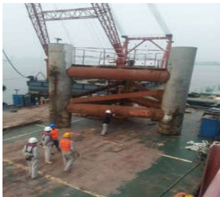
图3 水下钢围堰拆除

黏土填充需要根据施工要求和围堰监测数据,对堤身开展黏土填充施工,实际操作时需要填充材料进行科学选择,并且在材料应用时也要按照分层施工方式加以操作,为保证填充材料还需要对填充厚度和进度进行控制,必要时还可以利用挖土机对其进行夯实处理。同时,在水利围堰施工完成以后,需要对其开展二次夯实施工,对围堰可能存在的