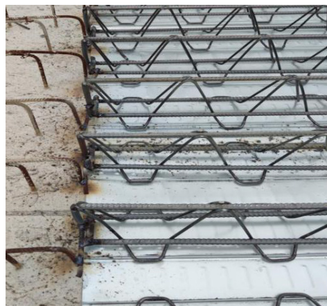
图 14 楼承板连接照片

实际搭接长度可能更小, 所有项目决定在安装的过程中, 采用安装一块楼承板就对楼承板进行两个焊点的固定, 保证在搭接长度不够的情况下, 也不存在安全隐患。此过程需要精细化管理, 对质量安全工程全过程监督。