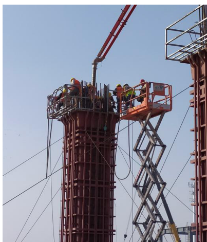
图 5 平台柱施工照片

在吊装后的柱脚钢筋灌浆也是重点，项目采用西卡专用灌浆料，在吊装前必须将灌浆料准备好，一旦钢柱模即将就位，迅速完成灌浆料搅拌，确保将波纹管填满后，再慢慢落入钢筋笼，将钢筋笼和钢柱模就位后，钢柱模用缆风绳固定。在钢柱模就位 24h 后进行柱混凝土浇筑施工。由于平台区柱截面较大，为 1.3m×1.4m，属于大体积混凝土，振捣采用 4 根振动棒，同时振捣，保证柱的混凝土的密实，保证大体积柱的混凝土成型质量。