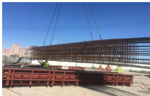
图 4 柱钢筋照片

柱钢筋定位做为柱施工中的重中之重，在钢筋笼绑扎的过程中，必须严格按照放样进行，并且采用钢筋网片定位，网片钢筋采用直径 20mm 的钢筋，网片距离不大于 1m，每两个网片设置垫块，保证浇筑完成的钢筋保护层厚度。在吊装前要对波纹钢管进行清孔，清除波纹钢管的水等杂物，保证柱脚专用灌浆的配合比不发生变化，从而保证柱主筋锚入承台的质量。