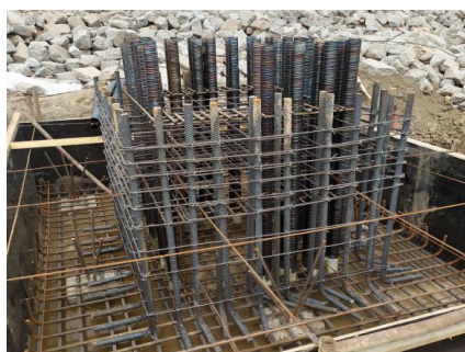
图 2 波纹钢管施工照片

金属波纹钢管的作用是对柱的锚固钢筋进行定位，在完成柱钢筋插入的情况下，增加基础钢筋的摩擦力。波纹钢管施工的重点在波纹钢管定位方面上，波纹管的定位根据柱主筋位置中心点设置，并进行平面放样。在施工过程中对波纹管位置严格控制复核，保证误差小于 5mm。项目在实际操作中采用钢筋直径 20mm 的钢筋网片对波纹管进行定位，保证定位网片的间距不大于 500mm，并在距离基础顶 300mm 和基础底 300mm 处各设置一道。网片的支撑固定在基础垫层上，这样保证在基础施工和混凝土浇筑的过程中不会因为基础主筋定位偏差影响波纹管的定位。为后续基础柱的施工奠定良好的基础。在波纹管的施工过程中，对波纹管的保护和封堵也十分重要，但容易疏忽，一旦波纹管内漏浆造成管道封堵，将会对后续施工造成严重影响，而且清理很困难。所以本项目在施工过程中对金属波纹管的下部封堵采用钢丝网加土工布的方式。波纹管的上部封堵采用 PVC 盖帽 + 土工布方式进行保护，避免施工过程中混凝土落入波纹管内，影响后续柱的施工质量。