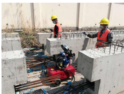
图 9 预应力梁张拉照片

在混凝土梁的强度达到 80% 时,对梁的下部钢筋进行一次张拉。(1)在张拉过程中首先要设置合理的张拉位置及顺序,保证对称张拉,避免梁的整体受力不均。(2)在张拉施工过程中,在控制张拉应力的同时还要控制伸长率,避免超张拉或张拉不足。(3)在张拉完成后 24h 至 48h 内完成灌浆作业,在预应力灌浆的过程中要保证灌浆的密实饱满。本项目梁的灌浆料采用的是 42.5 级的普通硅酸盐水泥,水灰比为 1:0.45。在搅拌后均匀后迅速灌浆,在浆体外溢后,迅速关闭阀门,继续加压,排净空气后关闭阀门,完成注浆施工作业。