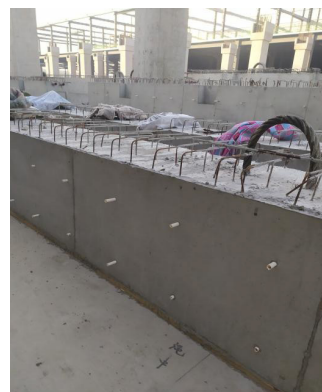
图 8 梁浇筑完成照片