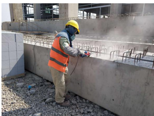
图 13 混凝土梁打磨照片

在吊装完成后, 楼承板加工前需要对现场尺寸进行复测, 本项目安排专职的测量人员对每跨楼承板的实际尺寸进行复测, 并在图纸上进行标明, 工厂根据现场尺寸安排楼承板的生产工作, 并对不同位置楼承板单独编号, 避免安装时位置难以对应。