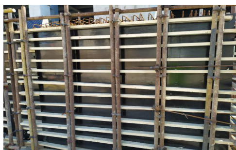
图 7 预应力梁模板照片

由于预应力梁的成型，直接影响混凝土的外观，所以严格要求模板质量，要求采用 18mm 厚的清水混凝土模板，对模板的周转次数进行严格要求，要求不大于 2 次。由于梁的高度较高，施工前对梁的侧模加固进行计算，对 2400mm 的梁，螺杆间距 300mm，保证梁的模板刚度。在混凝土的浇筑过程中，合理控制浇筑顺序，采用分段分层浇筑振捣，有一端向另一端浇筑，先浇筑一半，在初凝前进行第二层的浇筑，保证混凝土浇筑质量 [1] 。