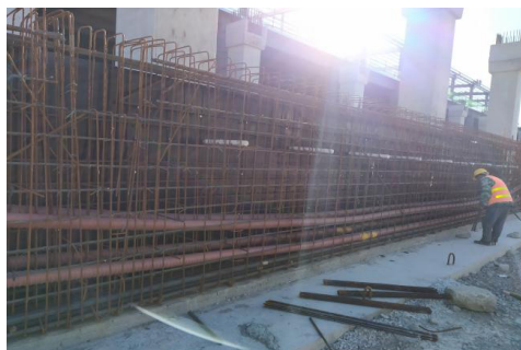
图 6 预应力梁钢筋绑扎照片

对于钢筋绑扎工序，关键还是钢筋的定位，要在端部设置不少于 2 道定位网片，保证钢筋的位置正确，并且箍筋的绑扎要和预应力波纹管的施工顺序匹配穿插。波纹管的穿插要在梁钢筋的外圈箍筋绑扎固定完后进行，封膜前要对波纹管的定位，失高进行复核。