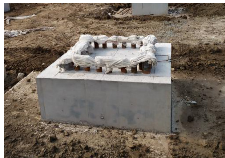
图 3 基础施工照片

基础顶标高是基础施工的另一个控制重点，由于项目采用定型钢模板，模板高度不可调整，所以基础顶标高直接影响上层柱标高的控制。项目在施工前和施工后分别进行复核，保证后续柱施工的顺利进行。