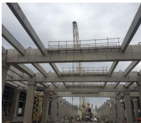
图 11 预应力梁吊装照片

在吊装作业过程中,根据每个梁的起吊位置进行策划,规划合理的吊车的运行路线,大大提高了吊装的安全性和施工速度。