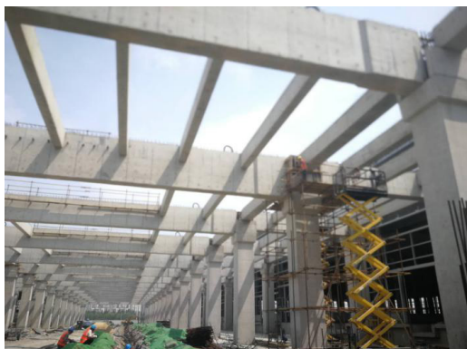
图 12 梁柱节点施工照片