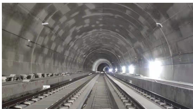
图3 铁路隧道施工现场

坚持“分级验收、试验先行”的工艺实施原则及“以点带段、亮点辐射”的工艺方法,对铁路施工项目中的难点开展工序模拟建造。在铁路隧道工程建设中使用激光点云技术,自动生成三维建模,通过对其尺寸差异进行分析,不断优化建设施工工艺,打造高品质项目工程(见图3)。