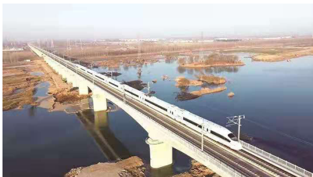
图2 中国徐宿淮盐城际铁路