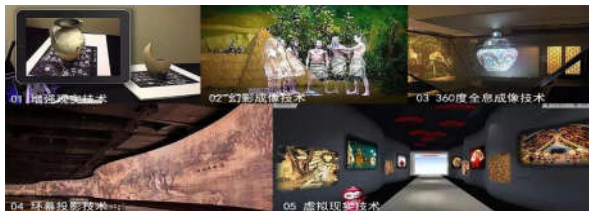
图2 常用的多媒体展示技术示意图

叙事学中的叙事媒介简单来说就是讲故事时传递信息的载体，用语言来充当媒介材料。叙事性表达设计的叙事媒介包括有展品、多媒体、展台、展柜、展板、展架、陈列设备等多种元素。其中展品本身就是具有历史文化的客观存在，博物馆的场景空间是通过展品的编排而产生，其体现了展品所拥有的意义，实现了有结构、有层次的组织场景。除了将展品进行展示的同时，还需要建立一个与观众产生互动的平台，用多媒体科技来提升场景空间的感染力（见图2），使观众和展品产生互动交流，进一步完善博物馆的社会教育职能，更好地发挥其可持续性。