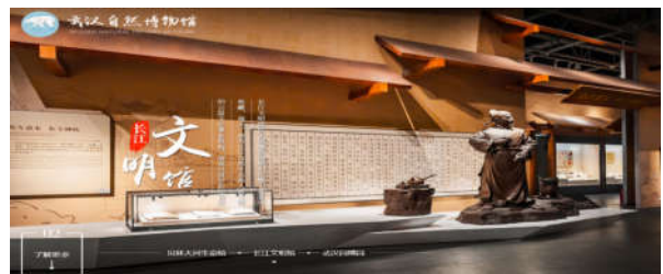
图3 中国武汉自然博物馆云展览

叙事性表达设计是一个双向的奔赴过程，观众也是叙事的一部分，观众在听故事的同时会无意识地由被动接受信息变成主动的探索信息。在叙事性设计中，要达到这种自然的状态，让观众在不知不觉中增加对展品的了解，在这种不知不觉的自然状态下产生趣味性。同时除了趣味性，还要有生活性的内容，通过更自然、便捷和人性化的方式，使得更多的观众从叙事性的展览中获取一些知识信息。在新冠肺炎疫情防控下，人们无法正常出门参观博物馆，大量的文艺展览就被“赶上云端”，博物馆也是推出了云展览（见图3），在家中打电脑或者手机，我们就可以浏览数字形式的博物馆，通过这种形式逛博物馆也越来越生活化了。