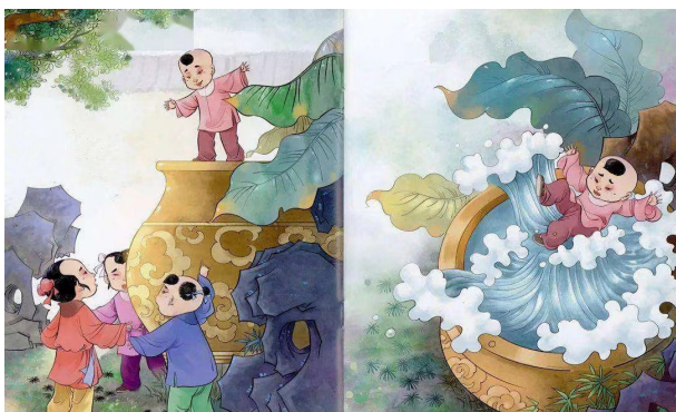
图2 《司马光》活动参照图