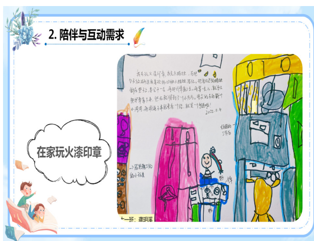
图5 幼儿居家游戏故事