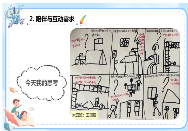
图4 幼儿居家游戏计划

我们的孩子非常喜欢画游戏故事。一天中的游戏内容、活动安排，甚至家里发生的一件小事，他们都愿意画下来。然后，他们就有倾诉和表达的意愿。但是目前的祖辈陪同、家长忙碌的现状，无法满足孩子的表达需求。所以，老师及时捕捉到这样的需求，通过一对一的电话、视频连线进行线上互动，一方面通过有效问题链帮助孩子梳理关于游戏的思考，另一方面对游戏故事进行认真记录。之后，找到合适的时间把这些记录反馈给家长，家长感受到的是老师浓浓的关怀和极高的专业素养，帮助家长更加了解自己的孩子，亲子互动能量满满。纵深式的资源包创建中，我们可以动态看到赋能家长、赋能幼儿发展的全过程（见图4、图5）。