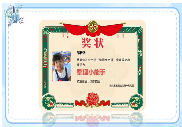
图7 互动活动反馈之一

针对居家阅读习惯的培养、孩子焦虑情绪的缓解、孩子生活作息规律、孩子居家运动习惯的养成等需求,都会制作个性化的互动计划和资源包,满足了不同家庭教育的个性需求,得到了家长非常好的反馈,家园共育成效事半功倍 [5] 。