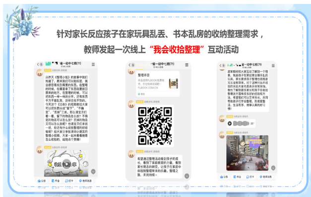
图6 线上收纳整理互动活动

比如针对家长反映孩子在家玩具乱丢、书本乱放的收纳整理需求,教师发起一次线上“我会收拾整理”互动活动:制作一个现象视频抛出问题、搜寻如绘本《收纳小姐》、收纳步骤图、习惯养成清单等资源,递进式的推送,引导家长循序渐进培养孩子整理习惯(见图6、图7)。