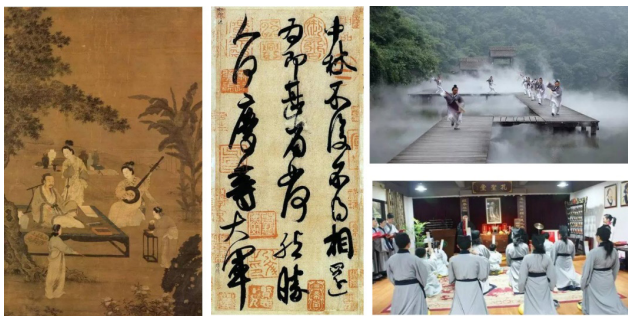
图1 中国传统文化代表元素

学中融入中国传统文化教育时,必须充分了解和把握其特点和规律,并将其与酒店管理专业教学结合起来,进而有效提高现代酒店管理专业教学质量。