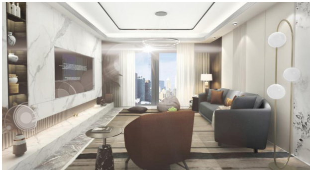
图 2 客厅设计效果图

务、主卧设计任务、书房设计任务以及厨房设计任务等分配给不同的学生，并要求学生利用 3ds Max 或 SU 软件渲染效果图的形式，进行设计成果展现。图 2 为客厅设计效果图，学生不仅可以对装饰施工工艺技术有一个全面的掌握，还可以对现代简约风格三居室室内设计的相关施工材料及流程有一个全面的了解。