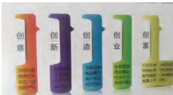
图2 “五创”路径教育理论

在对创新创业有了基本认知的基础上,培训内容沿着“创新创业发展路径”理论(图2),从微观层面引导教师实战体验创新创业中的“创意、创新、创造、创业、创富”环节,让教师们在“激发灵感、创新思维、最小单元实现、商业模式、资本运作”中提升对创新创业过程和创新创业所需能力的认知。了解创新创业是如何逐渐发生、发展和实现的,了解创新创业在不同阶段的能力提升过程。