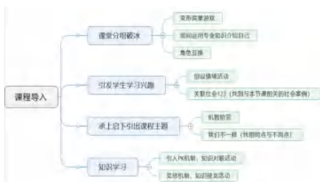
图3 教师创新创业培训工具包

在将创新创业融入专业课的过程中,课堂教育与创新创业的融合是重中之重。基于中职教师创新创业教育培训的理论体系和实践探索,开发研制了中职教师创新创业培训模型和工具包,如图3所示。这一全新模型重点关注创新创业教育的教学设计和课堂效果,专创融合工具包的可视化、智能化和产品化,使中职教师运用起来能够得心应手、信手拈来。