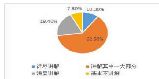
图1 教师对案例应用与讲解情况