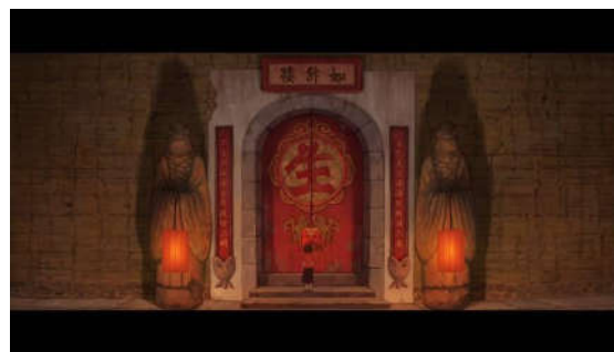
图3 电影《大鱼海棠》如升楼

除了角色形象以外，《大鱼海棠》的场景细节也是特别具有中国韵味。场景的取景全部都是来自于福建永定客家土楼，其中灵婆居住的如升楼的对联“是色是空，莲海慈航游六度；不生不灭，香台慧炬启三明”来源于佛家《般若波罗蜜多心经》中的语句，再加上锁里的太极阴阳鱼，象征着如升楼是掌管灵魂轮回的地方，而太极阴阳鱼还有另外一个寓意——不瞑守夜，因为鱼的眼睛始终睁开，所以可以日夜看