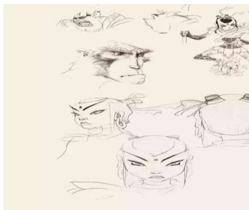
图6 电影《大圣归来》美设

黄毛、两块红股。”对比下《大圣归来》中猪八戒和孙悟空的形象设定，与原著文的形容的相当接近，猪八戒不仅画的很脏很糙，不像卡通动画里的可爱小猪，头上的鬃毛画出了猪八戒的狂野妖气，孤拐面形容的是面部骨头凹凸不平，雷公嘴形容的是下颚门齿前倾，结合起来很接近狒狒的形象，再加上深邃有神的火眼金睛，刻画出来一个有血有肉的孙悟空的形象。