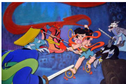
图1 动画《哪吒闹海》截图

说到中国动漫产业, 《西游记》《哪吒闹海》《大闹天宫》等引人入胜的动画场面从脑海中出现, 这些动画的成功与神话传说有着不可分开的密切联系。这些动画中以其鲜明的民族风格被世界成为“中国学派”。