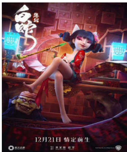
图4 电影《白蛇缘起》海报

自《大鱼海棠》和《西游记之大圣归来》上映以后，优秀的中国动漫仿佛雨后春笋般一个个出现。2019年上映的《白蛇缘起》人物场景细腻唯美，并入围了奥斯卡最佳动画长片初选。《白蛇缘起》的角色是以中国国画的线条美结合美式漫画的特点加强和日式漫画的人物比例的混合设定的，既符合了当下观众的审美，又有满满的国风。场景道具的制作则大量保留了中国元素，“路转峰回出画塘，一山枫叶背残阳。”《白蛇缘起》中有个描述满山枫叶的场景（如图5所示），既运用3D技术展示了画面虚与实的结合，又体现了中国山水画的独特意境美，王国维当年看到的应该就是此景吧。