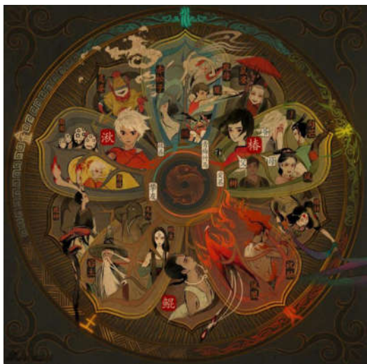
图2 电影《大鱼海棠》人物图

2016年上映的《大鱼海棠》从人物设计到场景道具设计都包含了满满的中国元素，《大鱼海棠》预告短片在网站上的期待分数高达9.5分，为当年所有即将上映电影最高分，并创下了45天里获得超过158万元资金支持创下中国众筹融资的记录，章子怡、佟大为、李少红、李玉等演员导演曾公开推荐该片，章子怡曾表示愿意为该角色配音。因此，《大鱼海棠》的前期宣传可谓是相当够分量，也因此证明了中国神话元素的魅力。