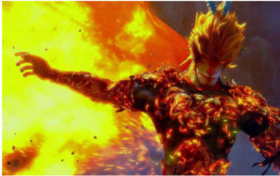
图7 电影《大圣归来》截图

也会因为挫折而丧气,正如那句“这是我管不了”表达出来的无奈一样,成年以后的我们何尝也是经常无能为力。当影片最后孙悟空穿上金甲,拿起金箍棒的时候,我们心中的希望和梦想又回来了。