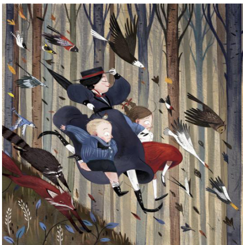
图1 茱莉娅·桑德拉《神仙教母》

所示)中将人物造型程式化,通过人物的外貌、穿着和使用物品进行区分,动物的造型也处理为扁平化和装饰围绕画面主体进行呈现。在另一个作品《爱丽丝梦游仙境》(如图2所示)中将周围物体的造型简略,主要的人物造型进行几何化归纳,以次序构成,突出了画面人物的和谐和气氛的安逸。