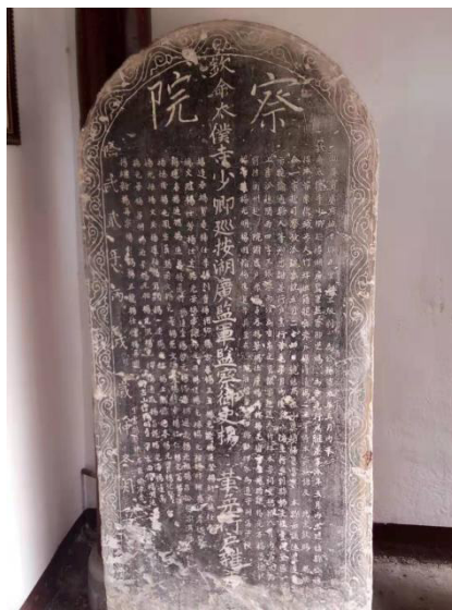
图3 明朝太仆寺卿湖广监军监察御史杨乔然监察湖广军赴城步大竹坪杨氏官厅题刻的“察院”石碑

在南宋由于杨再兴的英勇无畏的牺牲精神，给全国士兵提起了复仇的抗争精神，杨再兴部下纷纷要求为杨再兴报仇，以振国威，在明朝明英宗时期由于英宗是少儿皇帝才九岁，所有国内朝中大事由于谦把握，军事上由杨洪等“三杨内阁”共理军国大事，在军事上使瓦剌部占劣势，通过几次小战争，瓦剌部队连连吃亏后逐渐放弃了入侵。 [1] 使明朝恢复了安宁。杨洪的威名使北部瓦剌部属，闻风丧胆，谈杨色变，藏在山谷间的间谍，只要窥见旌旗知为杨洪，便奔窜相告：“杨王来也、不可出”！杨洪呈报的御敌之策“屡见嘉纳”。纪洪久居宣府，治军严厉，兵精马强，为当时边将之首，而且守边抚民，御外海内，勋功卓著位登极品。以致有万历十年彰武伯杨瑀回乡城步大竹坪杨氏官厅祭祖时题匾“勋裔”二字。