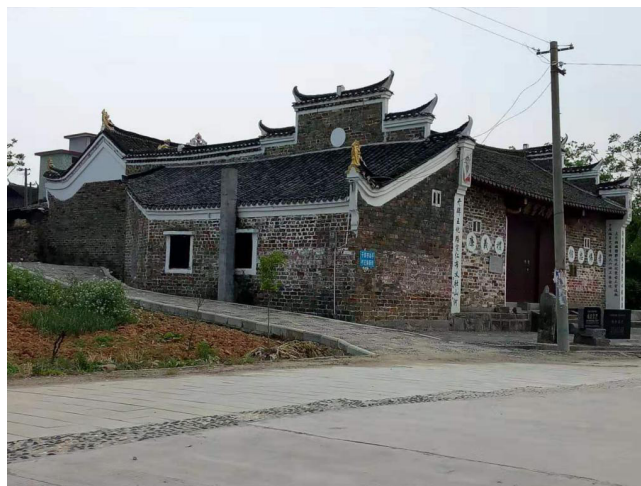
图 1 明朝洪武五年由湖广平章杨易创建的城步杨家将村杨氏官厅

英雄杨再兴不容辞的走在抗金前列与金军金兀术 20 万大军作生死搏斗，最后战死临颖县的小商河上。全国兀术杀害杨再兴后抢走了大量百姓（劳力和女人，老弱病残全部杀光）和数以千万计的金银财物、牛、马、羊牲口，给宋朝造成了重大的战争灾害，才有了岳飞的《满江红》“靖康耻、犹未雪、臣子恨、何时灭……”