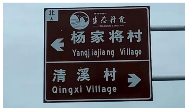
图4 城步杨家将村被国家住建部确定为国家级民俗文化村