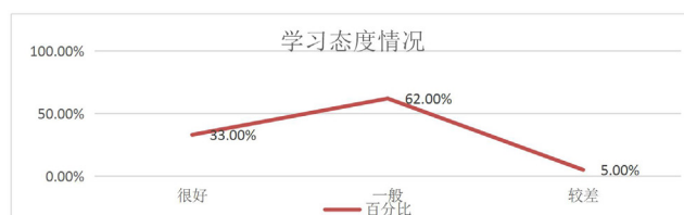
图 1 学生公共课学习态度情况分析

如图 2 所示,大部分同学并没有安排课余时间学习公共课,而单纯的课堂学习只能记忆浅层次的理论知识。同时,学习时间的单一性会造成“断层式记忆”,出现“学后忘前”的现象。另外,体育专业学生学习公共课的目的并不积极,很大一部分同学是为了拿到固定的学分而去学习,可以得出该专业学生学习公共课的内驱力明显的不足,自觉性和自主性不高的结论。