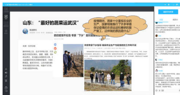
图 2 教学过程中的思政教育探讨(案例)

明确课程目标后,教师在授课过程中,应当结合授课内容适时进行思政教育的融合。以本课程绪论部分为例,在讲授过程中,绪论部分有一小节主要讲解了“土壤在农业生产和生态系统中的重要地位”,在讲解本节内容前,先向学生播放一个视频,视频截取了新闻联播中关于惊蛰春耕技术人员下乡指导工作的相关报道,视频结束后会向学生展示几张疫情期间各地向武汉运送蔬菜物资的相关报道截图,结合视频和截图,抛给学生一个启发式的问题(疫情期间,国家十分重视农业的生产,国家相继推行了许多举措保证疫情的农资运送和春耕的复产复工,这样做的原因是什么?)来组织学生进行自由讨论,结合谈论结果,将问题引入在中国农业生产的重要性上来,再紧接着抛出第二个话题(土壤在农业生产和生态系统中又扮演了什么样的角色?),将课程又从思政教育拉回到了专业理论知识的讲解,最后对土壤的重要性进行总结,总结的过程中向学生传达保护农业土壤,热爱农业事业的主人翁意识,从而形成“思政教育—专业教育—思政教育”的基本模式,有效地加强学生思想政治观念的培养与教育(如图 2 所示) [3] 。