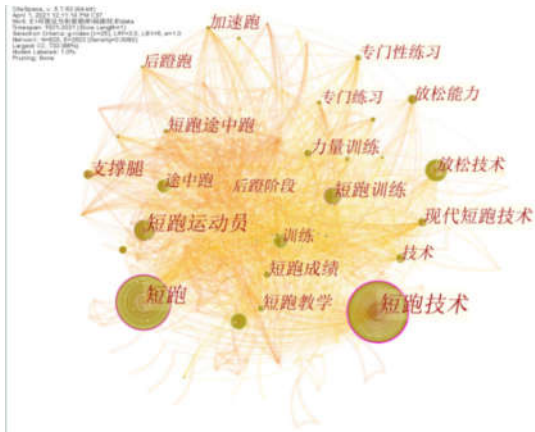
图3 中国短跑技术相关研究关键词共线分布图

结合图3、图4以及表2，可以分析出中国短跑技术研究趋势可分为以下几方面：以初中生体育和青少年体育为主的短跑技术教学和短跑技术训练；田径技术训练中的放松技术和摆臂技术；田径短跑后备人才培养。