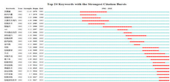
图4 引用次数最多的24个关键词