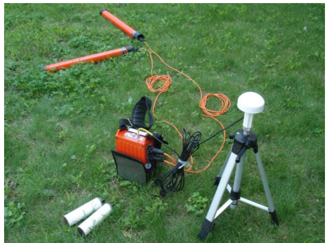
图2 MT5大地电磁法仪系统

电磁法勘探技术也是一种地球物理勘探技术，其特殊性在于所有的勘探操作需要处于自然磁场或人工磁场环境当中。勘察人员的工作任务有两项：一是观察，二是分析。观察目标为被测位置的深度和各物质的电阻率，分析内容以岩石层的分布规律为主。在完成观察任务与分析任务之后，也就能够对各岩石电学性质有一个准确的把握。与其他勘探技术相比，这种勘探技术的应用优势在于勘探深度大，能够满足岩层勘探工作需求。在应用这种勘探技术的时候，最常使用到大地电磁法。这是一种人工控制方法，可以消除自然磁场中信号差等因素对勘探结果的影响。图2为MT5大地电磁法仪系统。