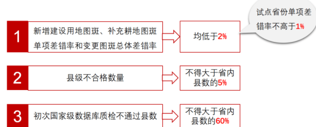
图2 更新成果质量评价指标

把收集上来的数据进行整理处理后,直接上传到国土调查云软件中,并利用在线举证的途径对佐证材料进行上传,并将其存储到运算服务器中;完成数据上传工作中,需要对数据质量展开全面性核验和调查,确保其真实性与准确