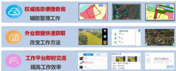
图3 国土调查云应用优势

通过这种方式可以对现场资料进行直接调取和查阅。由此可见,通过国土调查云的应用,对原有的工作流程进行简化和优化,改变以往集中变更的落后模式,而改善日常变更,减少日常工作的工作量的同时,也可以对各个零散时间的变更情况进行精准调查与核查,实现即时性审核,促进日常管理工作的效率和质量。其中国土调查云在各级自然资源管理部门中的应用优势如图3所示。