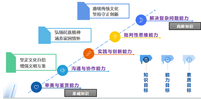
图 1 课程思政教学目标

针对课程教学以及课程思政实施的痛点问题，探索出“知山知水、鉴古知今，树木树人、育德培智”的思政教学方向和重点。将课程目标分为知识目标、能力目标和素质目标，通过知识传递着重培养学生创新与实践等高阶能力，引导学生价值塑造。进而形成优化课程思政目标、充实课程思政内容、改进课程思政教学模式、完善课程思政评价体系的课程思政建设理念，如图 1、图 2 所示。