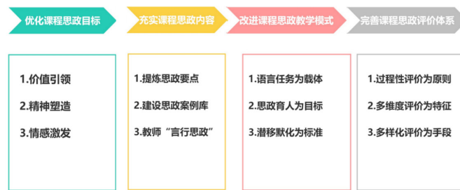
图 2 课程思政建设理念

①优化课程思政目标：通过全面梳理中西方园林发展变迁历史，引导学生区辨不同发展阶段及国家的园林特征，加强核心知识与前沿理论学习，拓宽学生视野。将传统的培养民族自信家国情怀的思政目标进一步优化，从价值引领、精神塑造和情感激发方面，培养学生的文化自信和文明互鉴。继承和创新中国传统园林造景理论和方法，认识自我、守正创新，坚定中国特色的风景园林演进之路。