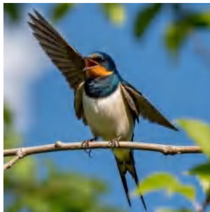
图2:在树枝头喳喳叫的小燕子