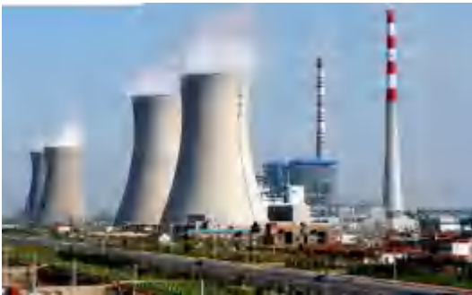
图1 化工企业的碳排放图

化工企业在低碳减排过程中，产能过剩与产能扩张的矛盾尤为突出。随着化工行业的快速发展，产能发生持续扩张。但市场需求增长相对缓慢，导致产能过剩问题逐渐严重 [5] 。产能过剩与产能扩张的矛盾不仅增加了企业的运营成本，还使企业在节能减排方面面临更大的压力。在严格的排放约束下，企业需要投入更多资金进行环保设备升级和技术改造，进而降低能耗和减少排放。但是，产能过剩会使企业无法获得足够的经济回报来支持这些投入，从而影响了低碳减排工作的推进。化工企业的碳排放如图1所示。