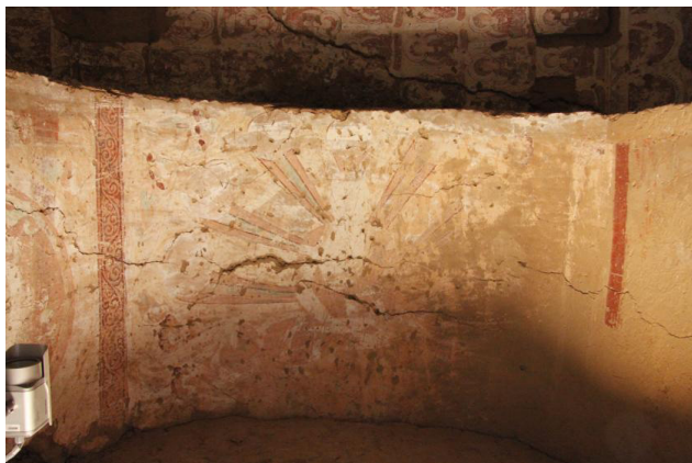
图1 雅尔湖4号窟拱形门顶坐禅比丘

第4窟主室拱形门顶绘坐禅比丘一身（图1），最具特点的是其身光为条幅式，这种头光也是该窟的特点之一，比较柏孜克里克第9窟中心柱后壁主尊残存桃形背光也是类似的光芒型头光。