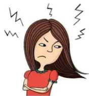
图 7 表达重度违愿语义