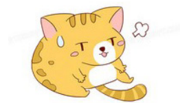
图3 表达违背说话人心理意愿的动画

从多模态角度对汉语违愿语义进行研究的另一大优势是可以提高听话人的语境感知能力,从而更好地理解汉语违愿语义。所谓语境是指言语活动发生时所存在的场合,即包括上下文语境和物理语境这样的外显性语境,也包括说话人和听话人的社会地位、文化知识和交际目的这样的内涵式语境。图3和图4是当下较为流行的GIF动画表情,它们属于图像模态范畴,是外显性语境的一种。外显性的语境要求有一定的物质外壳做依托,让交际双方都好把握。图3和图4通过动画卡通形象来表示抽象的违愿语义,对言语交际双方建构和理解违愿语义的促进作用比较明显。