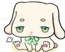
图4 表达违背说话人心理意愿的动画

运用多模态的方法对汉语违愿语义进行研究的第三大优势是可以帮助听话人来确定违愿语义的程度。违愿语义程度是语言中的隐含信息,它反映了说话人的情感态度。和其他语义类型一样,违愿语义也可以根据违背说话人心理意愿