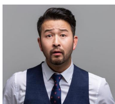
图 5 表达轻度违愿语义

例 5、例 6 和例 7 都是表达违愿语义的句子, 但是表达违愿语义的程度却各有不同。如何把握说话人要表达的违愿语义程度, 目前却没有统一的评判标准。通常来说只能依靠听话人经年累月培养起来的语感去判断。即便是以汉语作为母语的人的语感水平也是参差不齐的, 而对那些以汉语作为外语的留学生来说, 通过汉语语感来判断违愿语义强弱程度则是极其困难的事情了。图 5、图 6 和图 7 展示的是不同汉语违愿语义的程度, 可以看得出来这些图像模态寓意丰富, 可以帮助听话人更好地话语内容和违愿语义的强弱程度。