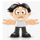
图2 表达违背说话人心理意愿的图片

从多模态角度对汉语违愿语义进行研究的另一大优势是可以提高听话人的语境感知能力,从而更好地理解汉语违愿语义。所谓语境是指言语活动发生时所存在的场合,即包括上下文语境和物理语境这样的外显性语境,也包括说话人和听话人的社会地位、文化知识和交际目的这样的内涵式语境。图3和图4是当下较为流行的GIF动画表情,它们属于图像模态范畴,是外显性语境的一种。外显性的语境要求有一定的物质外壳做依托,让交际双方都好把握。图3和图4通过动画卡通形象来表示抽象的违愿语义,对言语交际双方建构和理解违愿语义的促进作用比较明显。