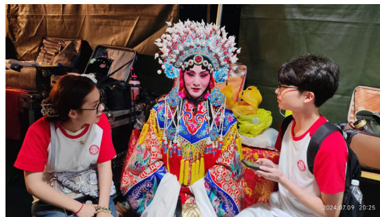
图2 秦腔演出后台实地采访图

团队与岐山县当地秦腔传承人进行交流,通过对他们的采访和当地对观众的调研(见图2),使团队对传统秦腔剧目有更高层次和全面的解读,完成新式秦腔剧本的改编。