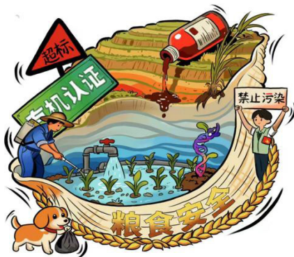
图 2-2 学生史柯怡作品《粮食安全》