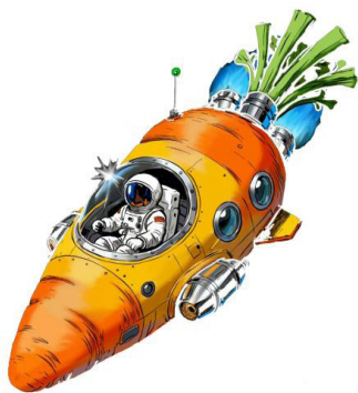
图 2-1 学生胡源博作品《星“萝”起航》

第三，文化转译，即传统符号的现代演绎。特定空间的图形创意构成形式也需服务于文化表达，通过“拆解文化符号，融合精神内核”，再与现代设计理念相融合，使传统文化以新颖、时尚的方式呈现，完成“传统与现代”的精彩对话，让古老的文化符号焕发出新的生机与活力。