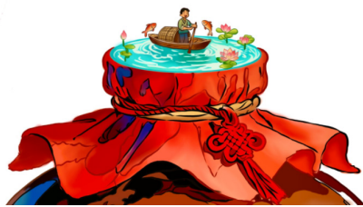
图 3-3 酒坛盖顶部的特定空间

文化空间的“意象融合”不仅局限于物理形态的还原，而是通过符号的隐喻、重组，传递空间的文化内涵。黄酒坛盖顶部通过特定空间展示了水乡意象。绍兴乌篷船置于瓶盖方寸之间，搭配水乡薄雾意象。既凸显“小空间藏大意境”的创意巧思，更以乌篷船的“航行”寓意黄酒文化的流淌与传承。同时，以色彩为载体，成为文化记忆的视觉编码。通过色阶渐变、冷暖对比与留白处理，传递地域文化记忆。作品以绍兴黄酒的“琥珀色”为主色调，通过色阶渐变模拟酒液的层次感，传递出“温暖”与“醇厚”的意象。此外，坛口运用了置换同构的表现形式，将绳结置换成了中国结。坛口原绳结的核心功能是“固封，守护酒质”，而中国结作为中华民族最具代表性的传统符号之一，本身就承载着“联结、守护、圆满”的文化基因，体现了中国传统文化的传承，也实现了传统意象与当代审美的有机统一，如下图 3-3 所示。