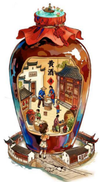
图 3-1 学生史柯怡作品《醉忆·绍兴》