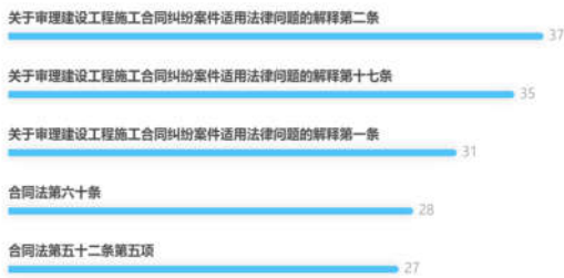
图2 适用的法条数据

对于案件中的建筑施工企业内部承包合同效力的认定，其中 77.81% 都被认定为无效合同，其核心原因都是法院认定为构成承包人非法转包、违法分包建设工程或者没有资质的实际施工人借用有资质的建筑施工企业名义与他人签订建设工程施工合同。通过上述数据可以显示出，虽然签订内部承包合同是十分常见的，但是一旦诉讼发生，内部承包合同被法院认定无效的概率是十分大的，如图 3 所示。