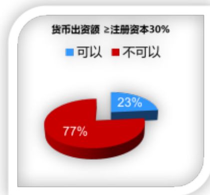
图1 最新会计资讯了解情况

学生都比较喜欢新鲜事物,特别对信息技术情有独钟。所以身为会计专业课教师,就要想方设法地借助现代信息技术,为教学服务,开发学生思维。因此,除课前、课中外,还应该在课后拓展内容下功夫 [4] 。利用互动平台,快速收集学生课外知识积累情况(如图1所示),作为新一代的会计人,更应关注最新会计资讯,做一名合格的会计人。