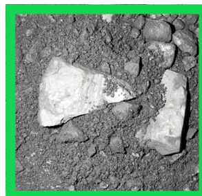
图3 改造前出料粒度

通过以上改进措施，大大改善了破碎机的出料质量，出料粒度为20mm以上占0%，10~120mm占4.8%，10mm以下占95.2%。为锅炉的稳定燃烧提供了保障(见图3、图4)。