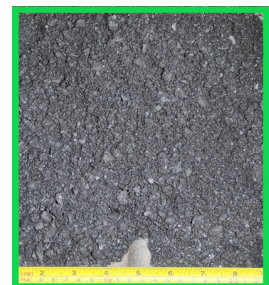
图4 改造后出料粒度