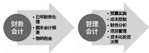
图2 管理会计与财务会计的区别

管理会计与财务会计的区别在于其关注的对象和目的不同。财务会计主要关注企业的财务状况和经营成果，通过编制财务报表来反映企业的财务活动情况。而管理会计则着重于为企业内部的管理层提供决策支持和管理信息，帮助管理层制定和实施战略、规划和控制企业的日常运营。管理会计更加注重运用各种技术和工具进行成本核算、预算管理、绩效评价等，以实现企业的长期发展目标。因此，管理会计是财务会计的延伸和补充，强调的是财务信息的内部管理和利用。此外，财务会计主要依据会计准则和法律法规进行核算和报告，其目的是满足外部利益相关者对企业财务状况的了解和评估 [5] 。而管理会计则更加灵活，可以根据企业内部的特定需求和管理目标进行定制和调整。财务会计主要关注历史数据和实际发生的经济活动，而管理会计则更加重视未来的规划、预测和决策。因此，在管理会计中，需要对财务数据进行分析 and 解读，以提供对企业未来发展的预测和决策的支持。管理会计与财务会计的区别如图2所示。