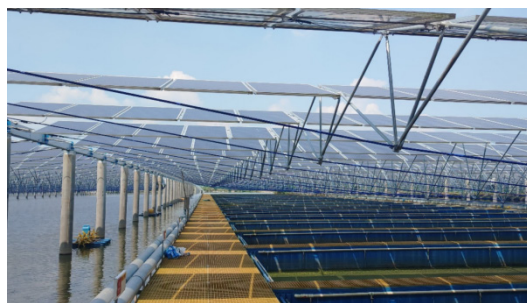
图2 柔性支架方案示意图

柔性支架固定式结构是指由柔性承重索、钢立柱、钢斜柱或斜拉索、钢梁及基础组成的一种支架，具有结构简单、材料使用少、质量轻、建设周期短等传统支架所缺乏的优点。柔性支架具有跨度大且跨度范围灵活可调、布置方案灵活、用钢量较少、基础占用面积小、安装灵活方便等优点。柔性支架方案示意图如图2所示。