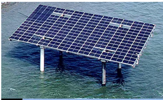
图3 小型双向钢桁架方案示意图

无需再设支架,结构整体性好,刚度高,抵抗外荷载能力强。小模块倾角更接近最佳倾角,尽量增加发电量,提高收益。小型桁架方案一般由4根PHC管桩基础和上部桁架结构组成,整体结构刚度较大,抗风、浪、流等环境荷载能力强。上部桁架结构及上部组件、附属电气等设备可实现陆上整体预制与安装,海上整体吊装,可大大减少海上作业工程量。模块小型化、轻量化,吊装施工资源适用性较强。小型桁架对水深及船机资源等限制较小,方案具备广泛适用性,方案可复制性较高。小型双向钢桁架方案示意图如图3所示。