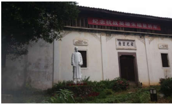
图5 朱福星将军纪念馆