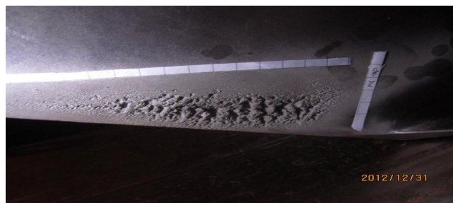
图2 2012年12月戈枕2号机组4#桨叶气蚀情况