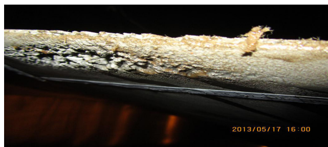
图4 2013年5月戈枕1号机组4#桨叶气蚀情况