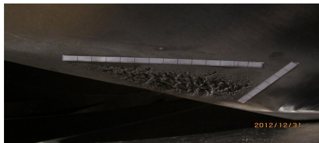
图1 2012年12月戈枕2号机组2#桨叶气蚀情况

修,未对水轮机过流部件进行详细的检查。直到2012年12月进行2号机组B级检修时,再在尾水管搭设平台进行检查。检查发现2号机组五片桨叶出水边均出现了较为严重的气蚀情况。气蚀均呈三角形分布,面积约 13 \times 6\text{cm} ,深度有 1\sim 5\text{mm} 。在2014年1月,对1号机组进行C级检修时,桨叶也发现了同样的问题,气蚀面积、深度等数据和2号机近似。(见图1、2、3、4)