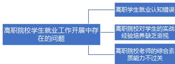
图2 高职院校学生就业工作开展中存在的问题

基于乡村振兴战略,高职院校学生就业工作的开展并不是一帆风顺的,在开展的过程中,常常会遇到各种各样的问题,不仅影响到学生个人职业的发展,也会阻碍乡村振兴的人才输入。如图2所示,高职院校学生就业工作开展中常常会存在学生就业认知错误,高职院校对学生的实战经验培养缺乏重视,高职院校老师的综合素质能力不过关 [5] 。