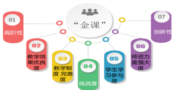
图2 财务管理专业“金课”建设标准模型

除此之外,教学效果的优良度、学生学习参与度、教学制度的完善度、师资力量的大度也对“金课”建设起到至关重要的作用,也为“金课”的衡量提供参考标准。在“两性一度”基础上,建立的财管专业“金课”衡量标准,简称“两性五度”如图2所示。