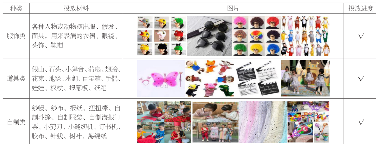
表3 幼儿园表演游戏区材料投放明细