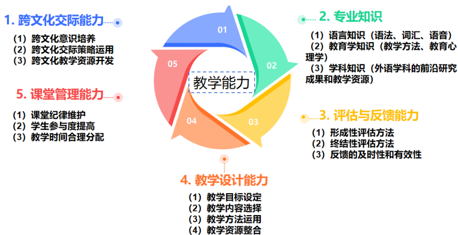
图1 教学能力五要素

根据构成要素之间关系的分析，本研究构建了一个综合的理论模型，如图2所示。该模型包括五个核心要素，各要素之间相互关联，共同构成教师的教学能力。