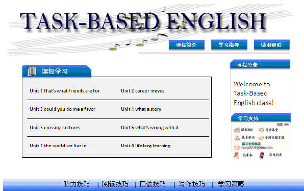
图4 中职《英语1(基础模块)》网络课程内容模块

利用内容导航进入具体的内容模块,主要有课程内容介绍、学习方法的指导、使用帮助。另外还设置了听力技巧、阅读技巧、口语技巧、写作技巧、学习策略等模块。