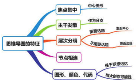
图2 思维导图的特征

思维导图的各个分支具有很强的连接性，学生在运用思维导图时很容易形成整体结构的记忆。图2主要展示了思维导图的特征，其主要包括焦点集中、主干发散、层次分明、节点相连以及图形、颜色和代码。由一个中心关键词，引发相关的思考，思维不断发散。另外，思维导图在制作过程中注意颜色的搭配，帮助学生增强记忆，加深理解，视觉上十分直观，有利于学生形成结构性知识 [1] 。