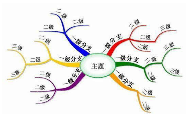
图2 思维导图的绘制方式