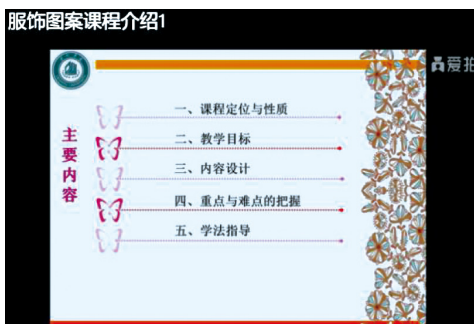
图1 服饰图案课程介绍