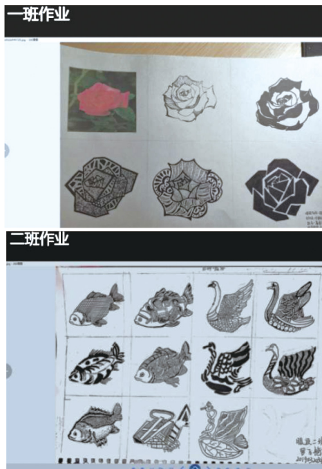
图3 作业点评视频截图

(1) 经过在线学习的有效组织，学生展现了积极的学习兴趣，大部分同学力所能及地完成了图案设计的作业。对于由学习委员汇总上交的作业，教师要积极分析，找出共性问题，录制视频，进行点评，逐一分析讲解。同时，也让大部分同学从另一个角度欣赏到自己的作品。