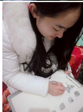
图2 学生在家进行学习和设计