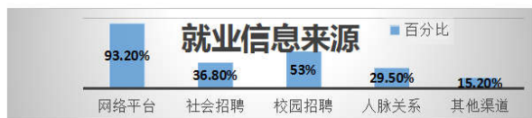
图3 就业信息来源统计表

随着现代科技的快速发展以及网络平台的高效性让越来越多的毕业生偏爱使用互联网查找、获取就业相关信息。调查显示，几乎所有人都在使用互联网渠道获得就业相关的信息，互联网获取就业信息虽然比较方便和高效，但在可靠性和准确性上有所折扣，所以毕业生在网络平台获取信息时要小心谨慎，以防上当受骗。还有53%的毕业生主要通过校园招聘获得就业信息，校园招聘的单位都是通过学校认可，相对而言，准确性和可靠性大大提升。同时一些毕业生还通过传统的人脉渠道如同学朋友介绍、各单位的招聘会以及人才市场的流通等方式直接获得就业信息（见图3）。