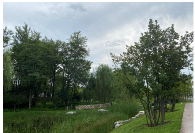
图3 因地制宜培养体系化蓄水、净水环境

人工湿地以现状湿地为设计基础，对能保留的现状景石以及现状水中岛进行保留，并对现状地形关系、边坡关系进行梳理与优化，整体形成区域内部三级台地跌水关系，第一级承接上游补水来水，水体以现状景石围合，面积约1000m 3 ，常水位480.50m，池底480.00m，驳岸高度为480.80m，蓄存水量约500m 3 。第二级蓄水空间承接第一级溢流排水，并通过两处新增景石设置带进行跌水进入第三级蓄存水体。第二级水体面积约7500m 2 ，水体深度为1.5m，常水位479.50m，池底478.00m，驳岸高度为479.80m，蓄存水量约11250m 3 。第三级蓄水水体承接第二级蓄水水体两处溢流来水，面积约44450m 3 ，常水位478.50m，池底476.80m，驳岸高度为478.80m，其中16550m 2 的底部区域底部高程为476.50m，总蓄存水量约80530m 3 ，可处理循环水量为7690m 3 /天。以因地制宜原则、生态性、功能性原则和整体性、景观性原则进行多学科多层次的交叉综合处理，分区、分段进行治理，根据北京的水土特点与气候特征，选择适合观赏的成片特色湿地植物，用水与游览栈道的分割使每个区域能够具有自己的群落特色及生态特色，岸线采用群落与线性结合的方式围合成具有较强观赏性的湿地生态群，提升可达性、观赏性与亲水性。图3为湿地景观一角。