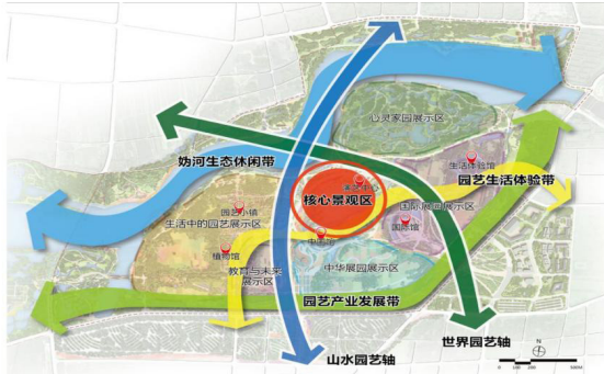
图1 世园会园区结构示意图

但确保栽植期和运行期的灌溉补水则显得尤为重要。在山坡上有层层梯田，由不同色系的常开花卉营造花田的节日气氛，对灌溉用水的需求进一步增加。因此，在天田山山脚的辋川园建设了地下加压泵站，为高大乔木的喷灌和层层梯田的滴灌提供水源保障，同时，还可为山顶仿古建筑永宁阁的消防和卫生间提供给水提供加压保障 [2] 。