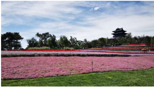
图2 2019年中国北京世界园艺博览会天田山实景图